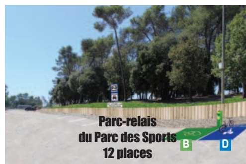
1 Parc-relais du Parc des Sports 12 places

Outre les places de stationnement habituelles, cet espace accueillera 6 parkings réservés au covoiturage et au relais bus.