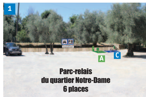
1 Parc-relais du quartier Notre-Dame 6 places

Chaque parc-relais réserve des places de stationnement à l'usage exclusif du covoiturage et du relais bus.