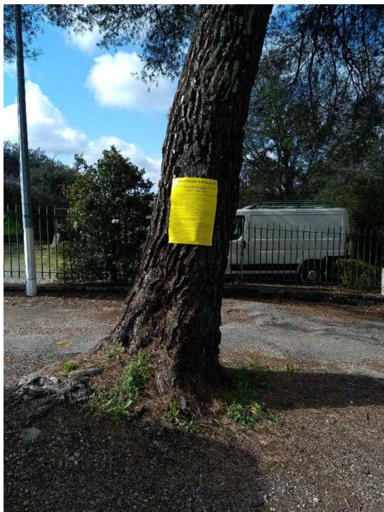
Photo N°6 chemin des Mouis attachée à la Main Courante N°2024001267