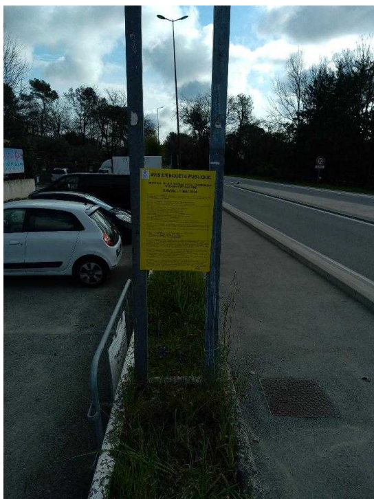
Photo N°4 RD 2085 Le Sinodon attachée à la Main Courante N°2024001267