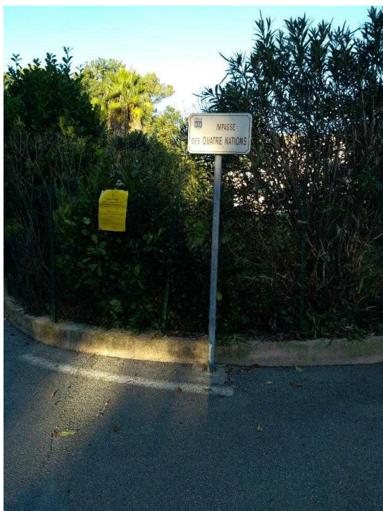
Photo N°8 Début chemin DINA GRAY par le chemin du ROMANIL attachée à la Main Courante N°2024004901

Photo N°7 chemin DINA GRAY niveau impasse des QUATRE NATIONS attachée à la Main Courante N°2024004901