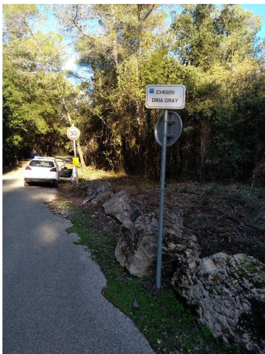
Photo N°6 Milieu chemin VIGNFRANQUET niveau chemin des LIONS attachée à la Main Courante N°2024004901

Photo N°5 Début chemin DINA GRAY par le chemin VIGNEFRANQUET attachée à la Main Courante N°2024004901